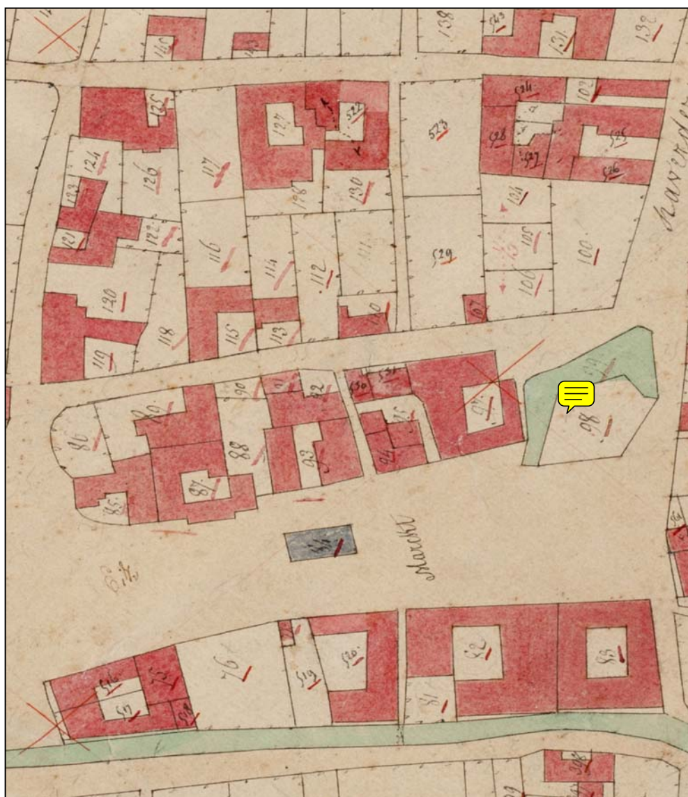
Detail van kadasterkaart uit 1832