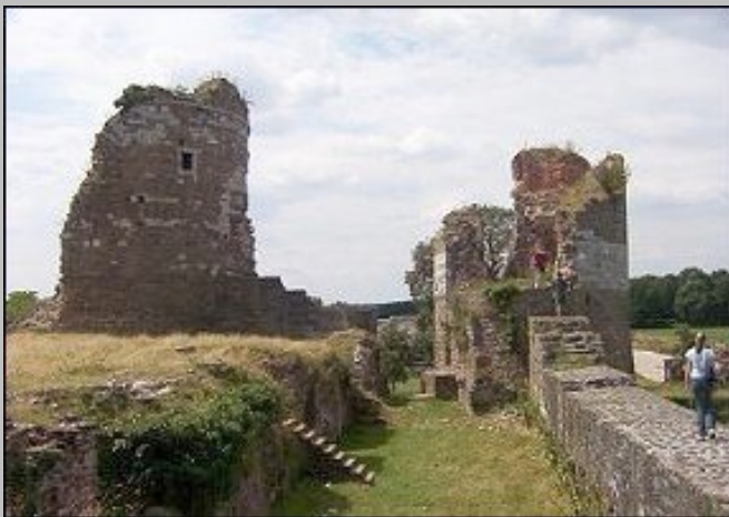
Ruïne van kasteel Montfort..

Illustratieve kaart uit het "Kaartboek der goederen van de koning van Spanje als hertog van Gelre in de heerlijkheid Montfort" door Taisne (1623).