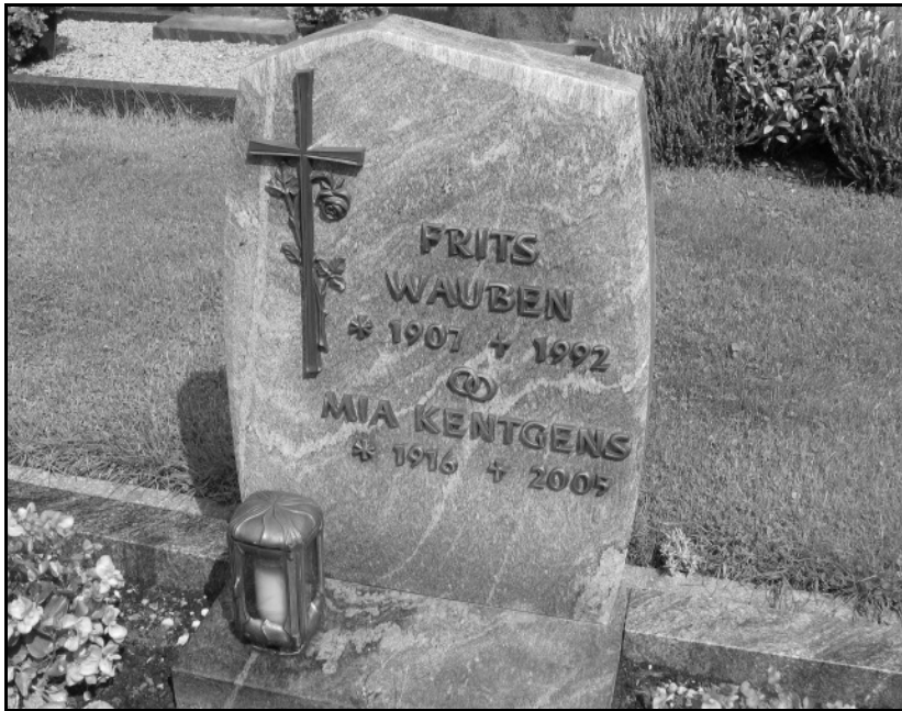
Elsene; grafnr. 4E07