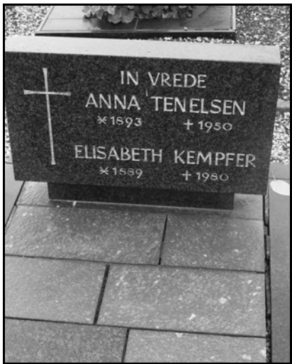
St. Jan; grafnr. B108