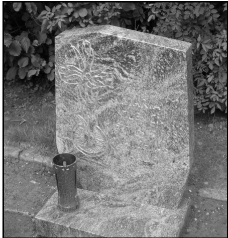
Elsene; grafnr. 4A02