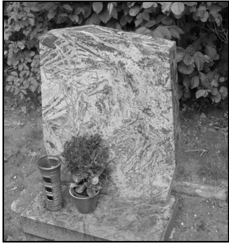
Elsene; grafnr. 4A01