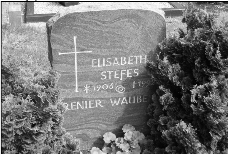
Elsene; grafnr. 4F01