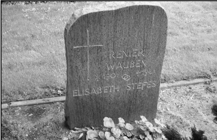
Elsene; grafnr. 3A02